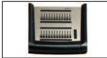
Módulo de extensión MENTOR